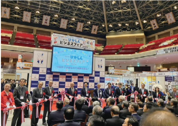
東京東信用金庫 ひがしんビジネスフェア2024(東京)

信用金庫のネットワークを活用して、全国の信用金庫が主催するビジネスフェアや商談会等を通じ、お客様に販路拡大の機会を提供しました。製造業や工芸品・食品を取り扱う、地元高岡の特色ある企業のべ26社が参加し、多くの商談がありました。