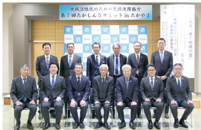
たかしん5サミット