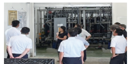
工場見学(五洲薬品(株))