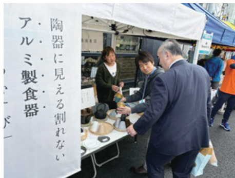
昭和信用金庫 シモキタ三ツ星パザール2024(東京)