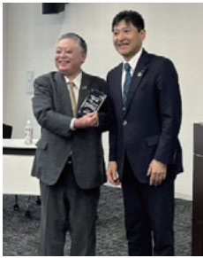
左より 永岩理事長、 共栄火災海上保険株式会社 工藤上席執行役員