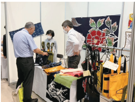
京都中央信用金庫 中信ビジネスフェア2024(京都)