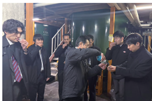
たかしん5優績者研修(酒蔵見学)

高崎信用金庫、高山信用金庫、高松信用金庫、高鍋信用金庫、当金庫の5つの「たかしん」による「たかしん5サミット」が2024年11月22日、高山信用金庫(岐阜県)で開催されました。サミットでは人事関連の取組に関する意見交換が行われました。