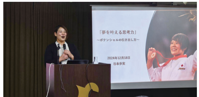
年末懇親会・基調講演(講師:女子柔道 アテナ・北京オリンピック金メダリスト 谷本歩実氏)