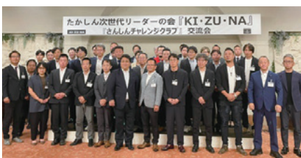
視察旅行(三島信金「さんしんチャレンジクラブ」との交流)