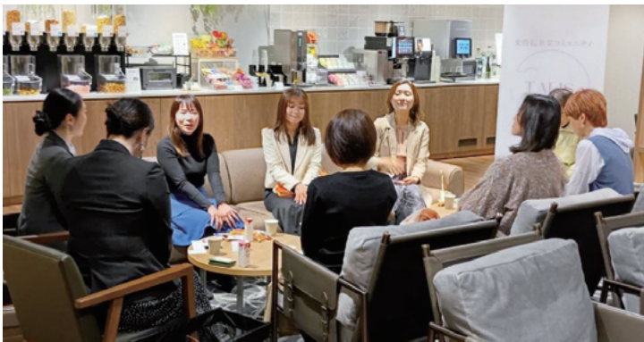
定期交流会「TALISカフェ」に参加する当金庫職員

高岡市創業支援施設「TASU」や女性起業家コミュニティ「TALIS」、富山県よろず支援拠点、高岡商工会とも連携し、創業を支援しております。