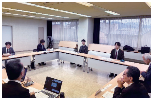
たかしん5優績者研修