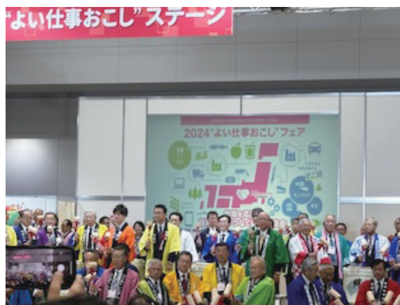
2024“よい仕事おこし”フェア 開会式

全国に254ある信用金庫が緊密に連携することで、地域を超えた事業者同士のマッチングの機会を創出するとともに、お取引先企業の経営課題解決につなげるための取組みです。